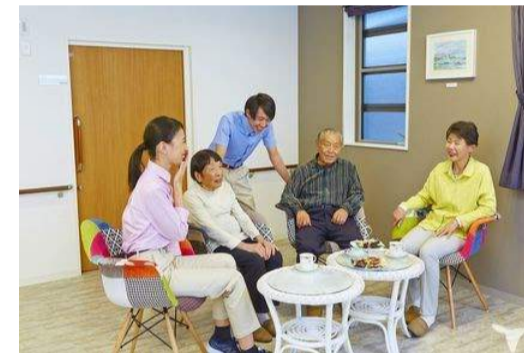
～サービス付き高齢者向け住宅～ 有料老人ホーム